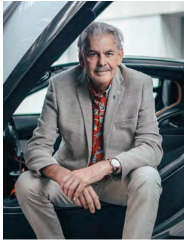
Britský konstruktér s jihoafrickými kořeny Gordon Murray se do historie zapsal jako autor nejlepšího supersportu všech dob, McLarenu F1 z roku 1992. S novým kupé GMA T.50 překonal sám sebe.

I když už to vypadalo, že unikátní třímístný kokpit McLarenu F1 zůstane navěky odkazem devadesátek, Murray navrhl jeho moderní podobu, a dokonce zachoval víc, než leckdo čekal. Duchovnímu předobrazu se nápadně podobá i tvar a rozvržení ovladačů kolem volantu a řadicí páky.