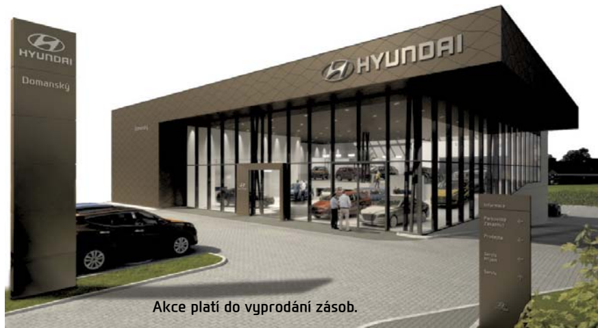
Akce platí do vyprodání zásob.