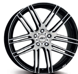
AEZ Cliff dark