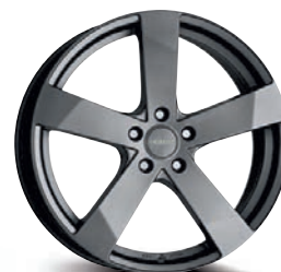
DEZENT TD graphite