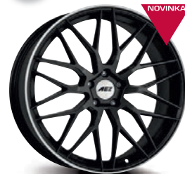
AEZ Crest dark