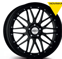
DOTZ Revvo black