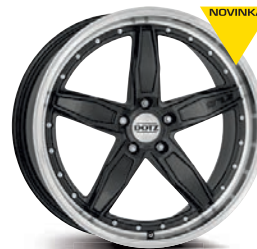
DOTZ SP5 dark