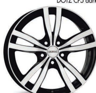
DEZENT TC dark