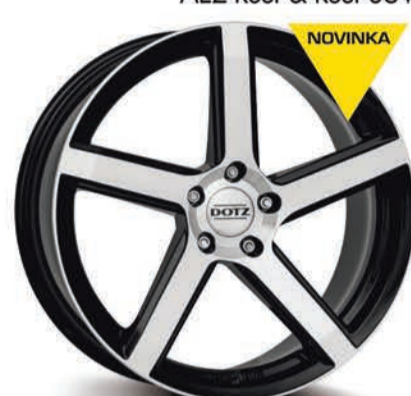
DOTZ CP5 dark