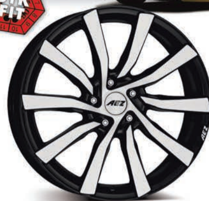
AEZ Reef & Reef SUV