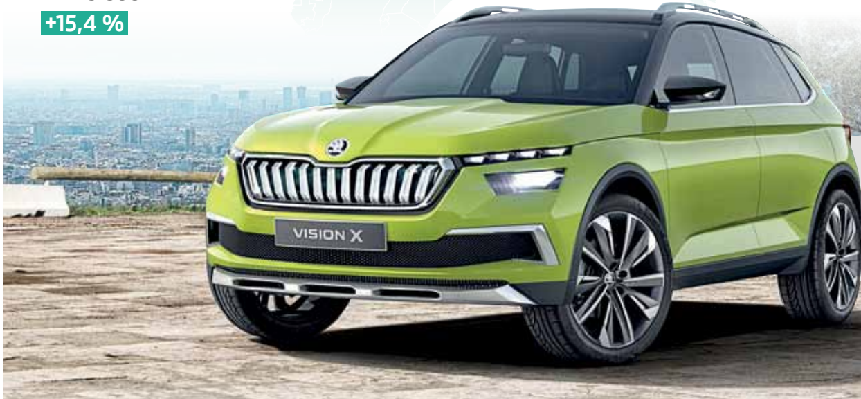
ŠKODA VISION X: Studie městského crossoveru měla premiéru na ženevském autosalonu 2018. Rozšíření nabídky se zaměřením na silně rostoucí segment SUV je významným pilířem Strategie ŠKODA 2025.