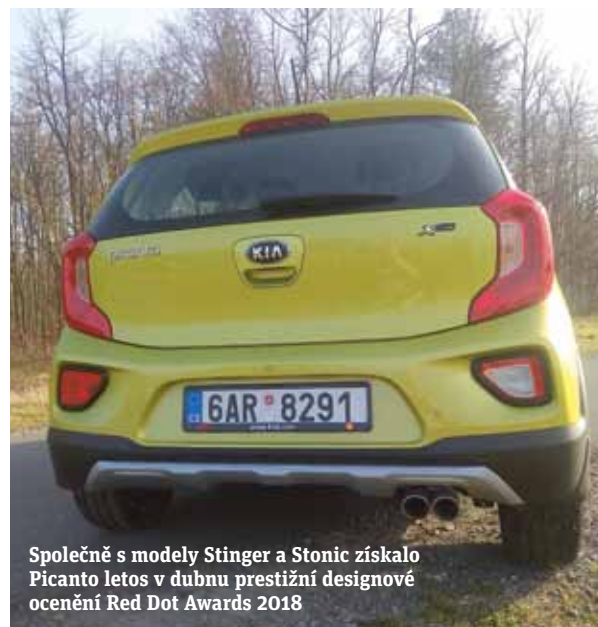
Společně s modely Stinger a Stonic získalo Picanto letos v dubnu prestižní designové ocenění Red Dot Awards 2018