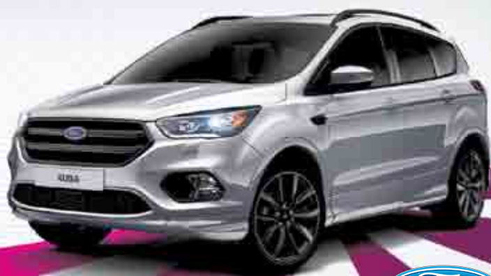
Foto je pouze ilustrační. Kombinovaná spotřeba Ford Kuga: 5,2-9,1 l/100 km. Ford je registrovaný výrobce.

NOVÝ FORD KUGA JIŽ ZA 479 900 Kč TOP EDITION