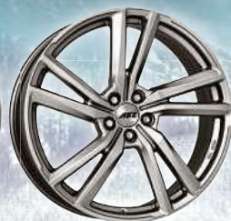
AEZ North high gloss