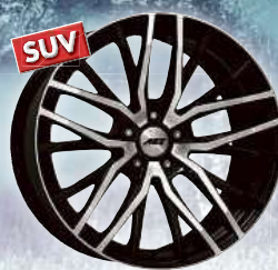
AEZ Panama dark

Kvalitní litá kola vhodná pro zimní provoz za akční ceny a s TYPOVÝM LÍSTEM!