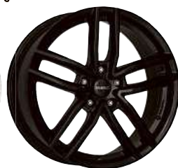
DEZENT TR black