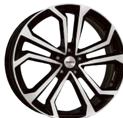
DEZENT TA dark