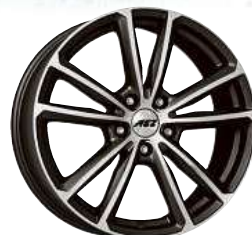
AEZ Tioga titan