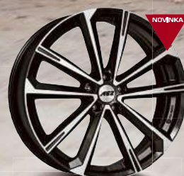
AEZ Aruba dark 18 - 21"