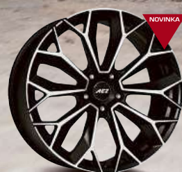
AEZ Leipzig dark 20" - 22"