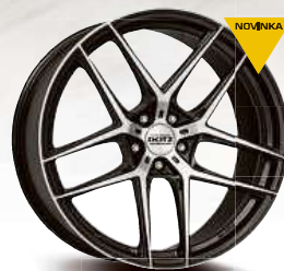
DOTZ LagunaSeca dark 19" - 21"