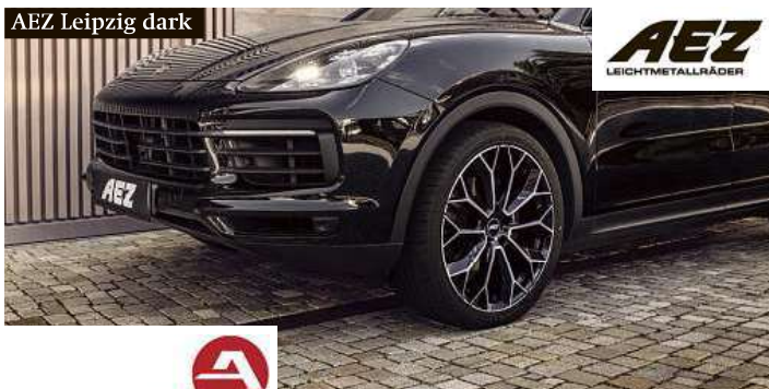
AEZ Leipzig dark

Alcar Bohemia svým zákazníkům opět zvyhodňuje nákup prémiových značek litých kol AEZ a DOTZ. Stačí si společně s koly objednat také bezpečnostní šrouby či matice Sicuplus. Ty dostanete od ALCARu jako dárek zdarma. Akce platí od 1. 3. do 30. 6. 2021 a motoristé ji tak mohou využít během celé jarní sezony přezouvání.