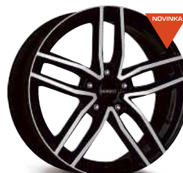
DEZENT TR dark 16" - 18"