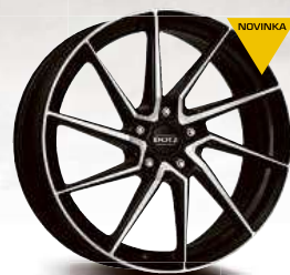
DOTZ Spa dark 17" - 19"