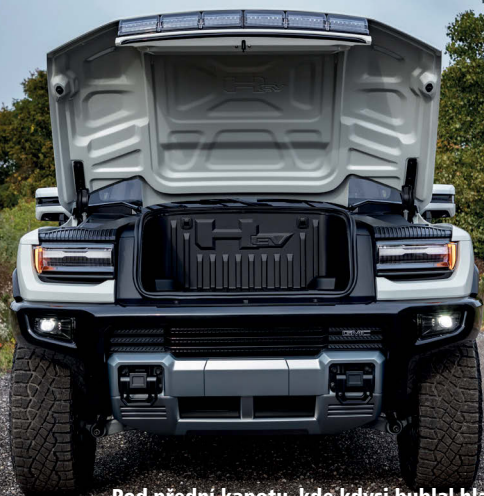
Pod přední kapotu, kde kdysi bublal hladový osmiválec, si dnes díky elektrickému pohonu můžete uložit zavazadla.