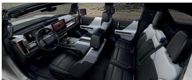
Originální hummer měl mezi dvěma zadními sedadly široký tunel, novinka je klasicky pětimístná.