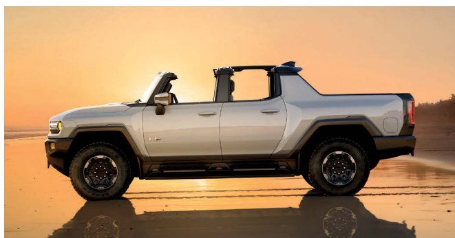
Kamerový systém nabídne rekordních 18 pohledů.

Jenže každý módní hit se omrzí, menší bráškové nenaplnili očekávání a bublina jménem Hummer v roce 2010 splaskla a značka zanikla. Časem proběhly neúspěšné pokusy o vzkříšení legendy ze strany čínských investorů, ale až nyní se zdá, že hummer skutečně vstává z popela. V podobě, která by skalní fanoušky nejspíš ani ve snu nenapadla – je z něj elektromobil!