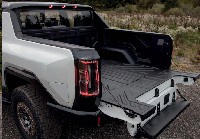
Jako první se představí verze pick-up, uzavřený wagon bude následovat.

V pozadí projektu nadále stojí koncern General Motors, který se rozhodl neoživit automobilku jako takovou, ale udělal z hummeru model své značky GMC. Ta se specializuje na SUV, pick-upy a užitková auta, do jejího portfolia tedy novinka hezky zapadne. Celým jménem vám tedy představujeme GMC Hummer EV.