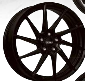
DOTZ Spa black