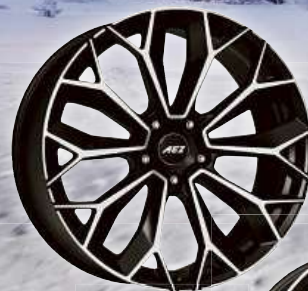
AEZ Leipzig dark

Kvalitní litá kola vhodná pro zimní provoz za akční ceny v originálních rozměrech nebo s Typovým listem!