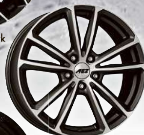
AEZ Tioga titan