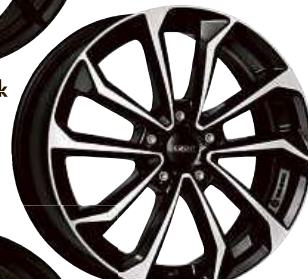
DEZENT KS dark