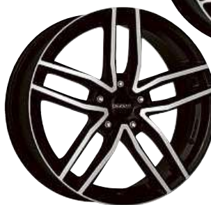
DEZENT TR dark