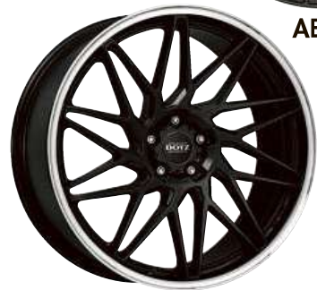
DOTZ Tanaka dark 18" - 21"