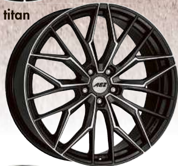
AEZ Porto dark 18" - 21"