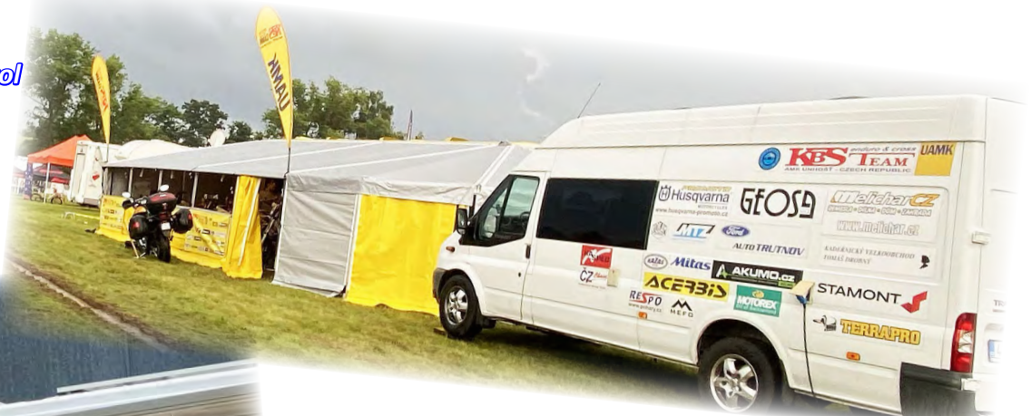
Zajištění servisních kontrol při akcích