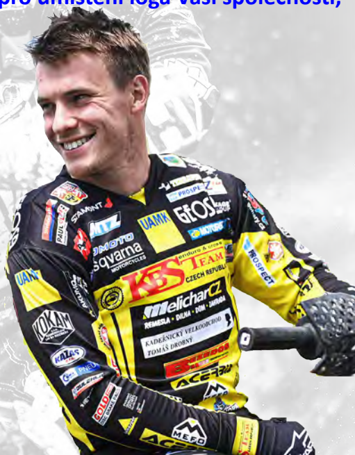
Umístění, velikost loga a případných bannerů bude upřesněno v uzavřené smlouvě.