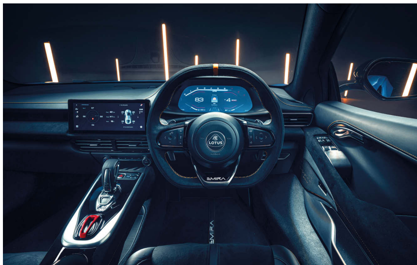
Interiér kupé je našlapaný luxusní výbavou, počítá se s každodenním využitím.