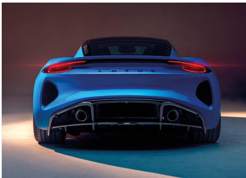
Emira je poslední model značky, u něhož řev výfuků neřadí bzukot elektromotoru.

zprostředkovat maximum koncentrovaných řídicích zážitků. Samozřejmostí je pohon zadních kol, a dokonce nám Lotus dopřál i manuální řazení, dvouspojkový automat nabízí za příplatek. Kvilející agregát uložený uprostřed vozu za sedadly posádky vymezuje emiru vůči dvěma konkurentům – Porsche 718 Cayman a Alpine A110, jejíž osmnáctistovka se ovšem může poměřovat nanejvýš se slabší, dvoulitrovou emirou. Šestiválec hraje jinou ligu. Lotus se sice nikdy nehonil za horečnými parametry motorů, ale v případě emiry mluvíme o 400 koních a až 430 Nm, což rozhodně není málo. Britské kupátko dokáže uhánět