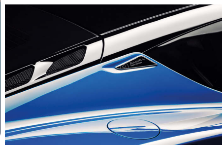
Každý záhyb na elegantní karoserii má jasnou funkci. Kapsy na bocích vedou vzduch k motoru, prolisy v kapotě zvyšují přítlak.