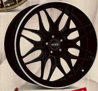
DOTZ LongBeach dark 20", 21", 22"