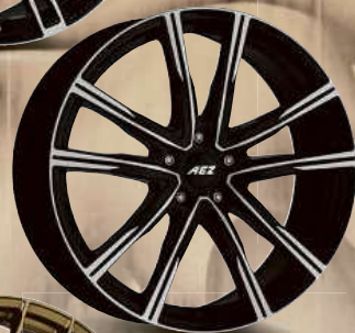
AEZ Montreal dark 18", 19", 20"