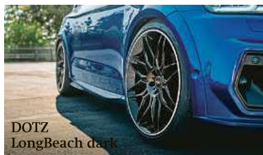
Novinka DOTZ LongBeach

Již tradičně je jarní období časem, kdy společnost Alcar Bohemia uvádí na trh své novinky. Ani letos tomu není jinak. V minulém vydání jsme vám představili dvě novinky osvědčených značek AEZ a DOTZ, které doplníme dalšími letošními novinkami od těchto značek. Samozřejmě můžete svého miláčka zkrášlit i jinými koly z široké nabídky od Alcaru. U všech kol máte navíc jistotu, že jsou homologována pro český trh. Výběr kol, která se pyšní tříletou zárukou, vám usnadní unikátní konfigurátor ve 3D zobrazení na webových stránkách www.alcar.cz , kde si můžete nejen zmiňované novinky prohlédnout na svém modelu automobilu. K sadě litých kol AEZ nebo DOTZ mohou nyní motoristé získat praktický bonus navíc. V případě, že si k jakémukoliv designu od značky AEZ nebo DOTZ objednájí ke kolům bezpečnostní šrouby či matice Sicuplus, dostanou je od ALCARu zdarma. Akce platí do 30. 6. 2023.