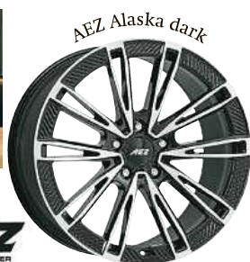
Novinka AEZ ALASKA