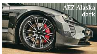
Novinka AEZ ALASKA

Elegantní vícepaprskové kolo je na míru vytvořeno pro elektrické sportovní vozy Porsche Taycan a Audi e-tron GT. Ve dvou barevných variantách s leskle černým lakováním a v kombinaci černého laku a leštěné čelní plochy nabízí možnost individuálního zkrášlení těchto futuristických prémiových vozů. V rozměrech od 9x20 do 11,5x21 palců je design AEZ Alaska schválen pro tyto elektromobily v originálních rozměrech. Sportovní elektromobily doplní svým mohutným vzhledem a díky optimalizované hmotnosti podpoří i jejich agilitu.