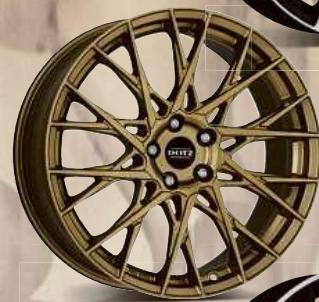
DOTZ Fuji gold 18", 19", 20"