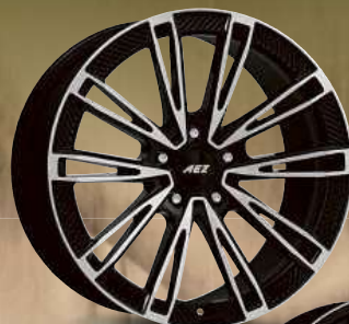
AEZ Alaska dark 20", 21"