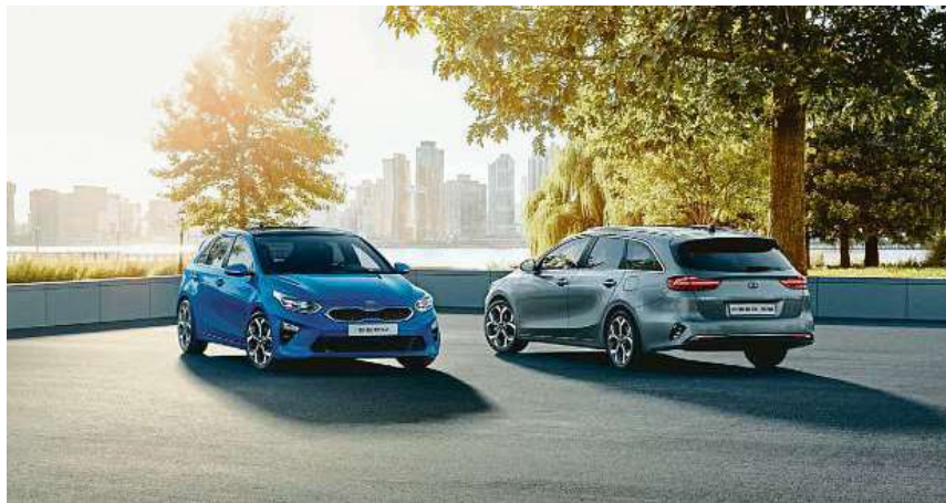
Akční výbava SPIN je k dispozici pro obě karosářská provedení hatchback a Sportswagon.

Akční model SPIN je k dispozici pro obě karosářská provedení. Akční verze, kterou české zastoupení automobilky Kia zařadilo do své nabídky, cílí především na