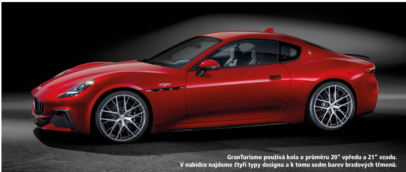
GranTurismo používá kola o průměru 20" vpředu a 21" vzadu. V nabídce najdeme čtyři typy designu a k tomu sedm barev brzdových třmenů.

Dnes již minulé Maserati GranTurismo by mohlo být klidně vyfoceno ve výkladovém slovníku u hesla „nadčasový design“. Představilo se v roce 2007 a do důchodu mělo jít o sedm let později. Nakonec se udrželo ve výrobě až do prosince 2019, tedy dlouhých dvanáct let. I na sklonku kariéry přitom vypadalo fantasticky, a hlavně neokoukaně.