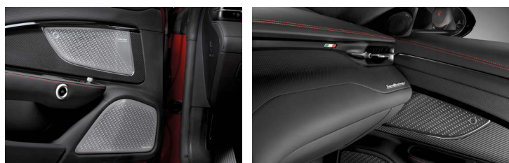
O hudbu na palubě se stará italská značka Sonus faber, domácí trikolora před spolujezdcem nemůže chybět.