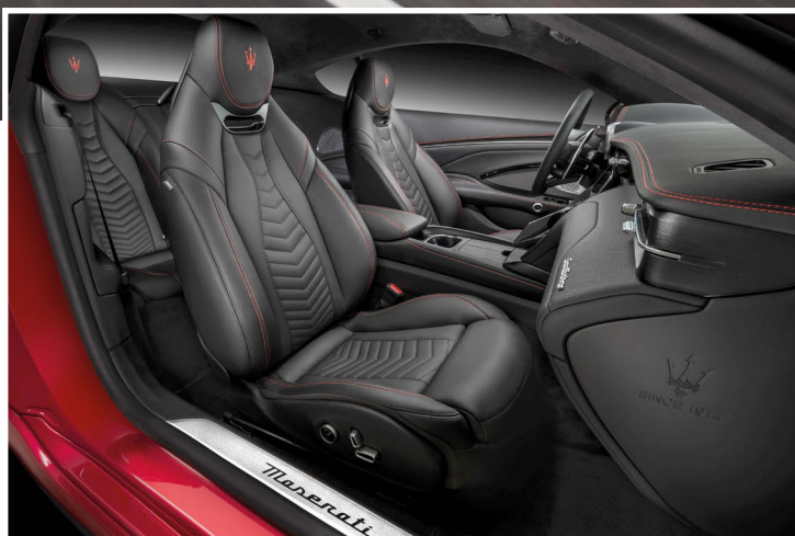
Podstatu GranTurisma představuje rychlost a luxus pro čtyři cestující.