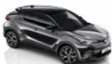
Šedá - popelavá (2NB)* se střechou v černé barvě