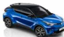
Modrá - vodní (2NH)* se střechou v černé barvě