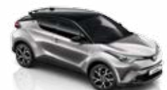
Stříbrná - kovová (2NK)** se střechou v černé barvě