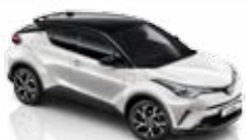
Bílá - perleťová (2NA)** se střechou v černé barvě